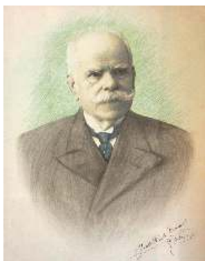
Lám. 5 Benito Prieto Coussent. Retrato de Ramón González. Lapis sobre fotografía. 75x45 cm. 1923. Colección particular.

Creo que as similitudes entre o debuxo a lapis (utiliza tres cores) e a fotografía da lámina 6, son evidentes: a pose, a actitude, o traxe, o alfinete de gravata (que cambia de posición), e a fisionomía. Nesta última, capta ata os máis mínimos detalles, como unha pequena espulla que ten D. Ramón baixo o ollo dereito. As cellas poboadas, e o cello lixeiramente pregado son característicos e a expresión enérxica e concentrada que podemos observar así mesmo noutras fotografías que se lle toman polos mesmos anos. Neste debuxo, podemos facer notar, como característica salientable, a maior suavidade das faccións.