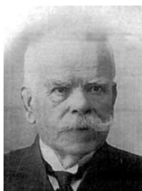
Lám. 6 Retrato de Ramón González.

Calculo que entre 1823 y 1825 fíxose este segundo retrato, un óleo sen asinar nin datar (aínda que consta nun papel que é da súa man), e que mostra o dominio que desta técnica ten xa o artista.