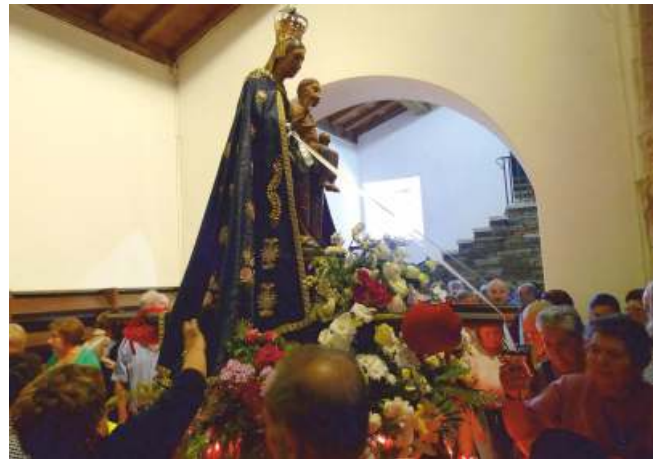
Rituais de contacto coa advocación mariana

Por outra banda, a dimensión sacra transmítese ao exterior, dun xeito directo, por medio da procesión. As imaxes que saen na mesma, santifican o espazo xeográfico que percorren, proporcionando unha enerxía positiva a todos os seres que se encontran no mesmo. Respecto á disposición da procesión, hai unha serie de trazos básicos: dentro da comunidade local é algo que chega vitalmente aos fregueses. Ademais, é mester reparar nas imaxes, no xeito de levalas, no pobo que participa e no que mira, así como no espírito da celebración reflectido en cantos, rezos, e mesmo no silencio.