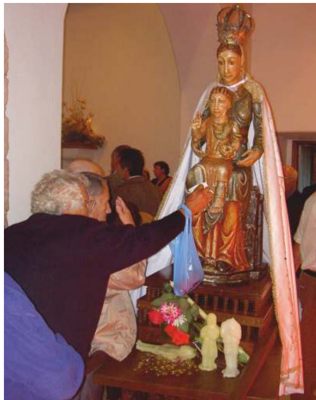
Ritual de contacto coa advocación mariana