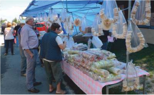
Posto de rosquillas

ou dunha posterior prestación cando chegue o momento axeitado. Segundo Marcial Gondar "cando o campesiño mercantiliza as súas relacións relixiosas.. .o que tenta é traducilas a unha dialéctica coñecida, que lle proporciona dúas vantaxes fundamentais: a comprensión pragmática dunha interacción, de por si misteriosa, entre o natural e o sobrenatural, e unha certa seguridade ou dereito emanante da reciprocidade co intermediario" 53 . Por iso os romeiros depositan esmolos e outras ofrendas, dando así cumprimento a súa parte no trato.