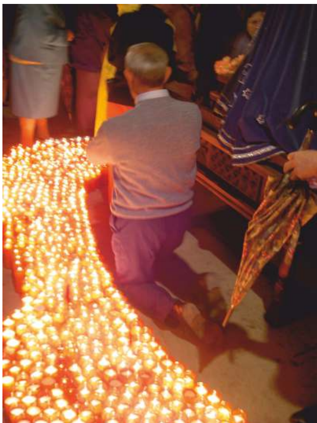
Ritual de xeonllos

Na nave norte sobresa a capela de San Bento, dedicada a este santo en recordo aos monxes beneditinos, que ergueron e custodiaron esta igrexa dende o ano 836 ao 1853.