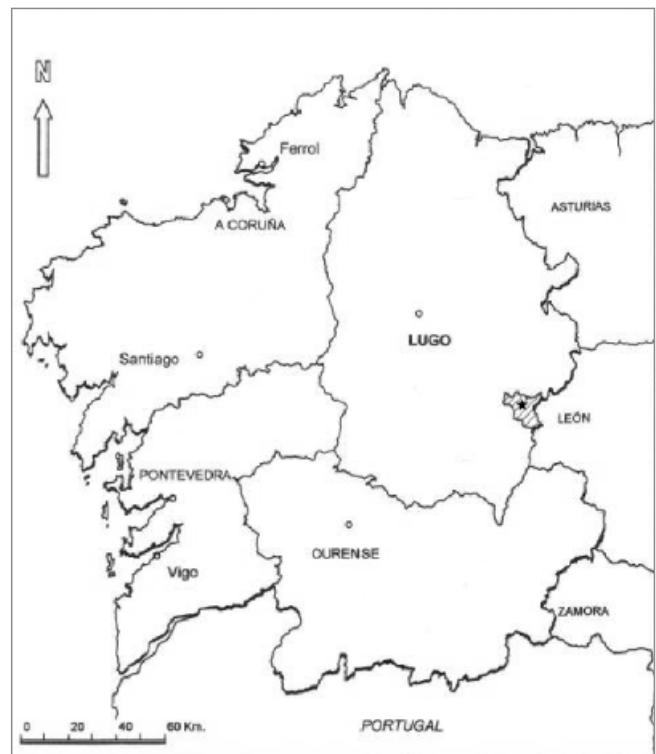
★ Localización do Santuario do Cebreiro

entre os concellos do Cebreiro e Vilanova do Padornelo, fusionados en 1835 no concello do Cebreiro. A súa adscripción xudicial cambiou ao longo do tempo. Así, de 1821 á 1840 permaneceu no partido xudicial de Cruzul; entre os anos 1840 e 1965 pasou a Becerreá; logo, ata o ano 1988, a Lugo; e, finalmente, volveu a Becerreá 4 .