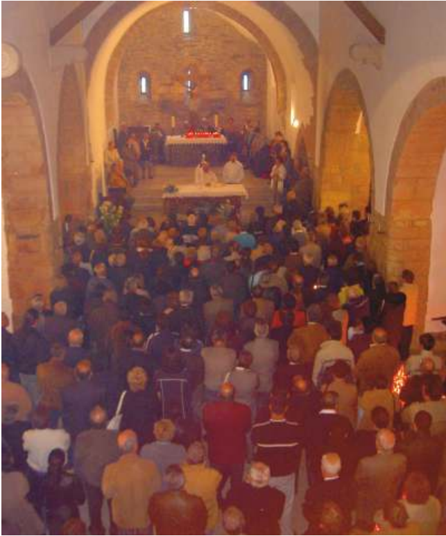
Misa no santuario

mellora nas colleitas, matrimonio, por traballo, por problemas de índole familiar e social etc. "Saúde, destino, matrimonio, sorte e axuda nos negocios son os pregos máis frecuentes dos romeiros de toda Galicia" 41 .