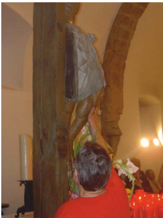
Ritual de contacto coas pernas do Cristo

"A tradición fai referencia a que preto dos inicios do século XIV un monxe do mosteiro esta oficiando a misa diaria na humilde igrexa do Cebreiro. Agás os domingos e días festivos, ninguén adoitaba acudir a oír a misa. Polo tanto, o crego estaba afeito a cumprir o seu labor sen fieis, e máis ese día que había unha forte treboada de neve. Cal sería a súa sorpresa, cando xa iniciado o ritual, chegou un home do lugar de Barxamaior, parece ser que da familia dos Santín, que