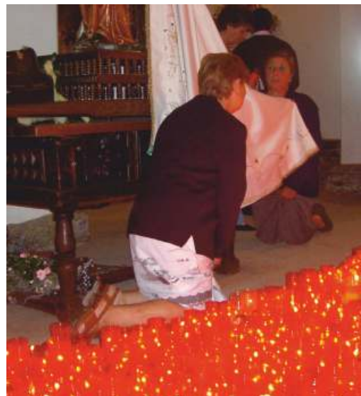
Devotas de xeonllos ao carón da advocación mariana