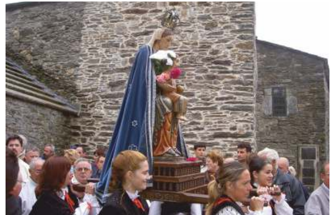
Detalle do ritual da procesión