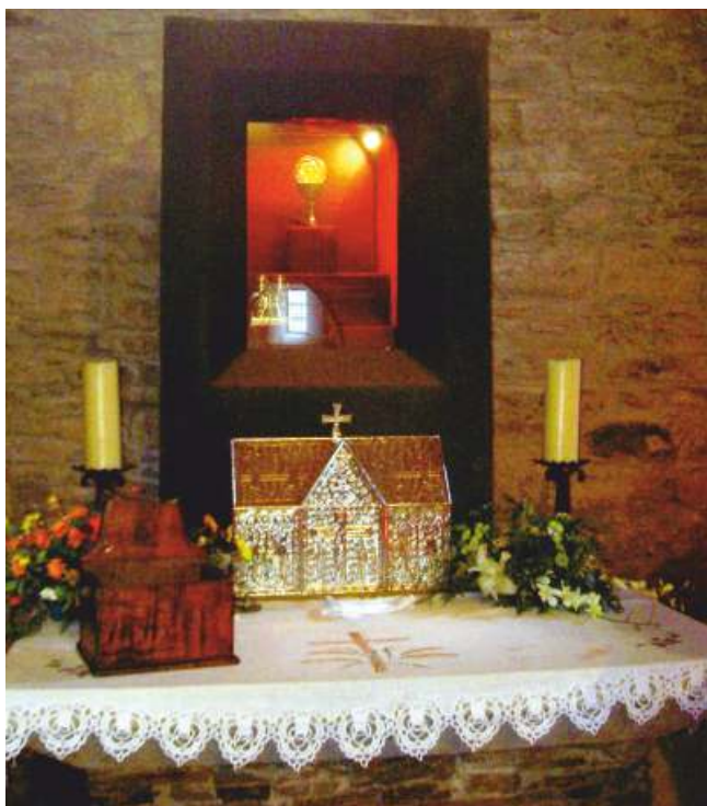
A urna blindada co cáliz, a patena e o relicario

O Cebreiro é unha pequena entidade de poboación que, segundo o Instituto Nacional de Estadística, posúe 27 habitantes. Esta situada na parte oriental da provincia de Lugo, a uns 1.300 metros de altitude. O motivo esencial de que esta pequena colectividade sexa coñecida dunha maneira universal débese a conexión que tivo dende sempre coas peregrinacións a Santiago de Compostela 6 . Así, é moi probable –segundo nos informa o P. Yepes– que ao comezar as peregrinacións, os monxes de San Bento construísen un mesón-hospital no ano 836 7 .