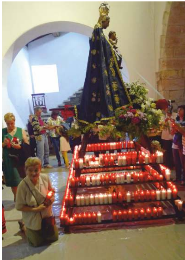
Ritual de circunvalación