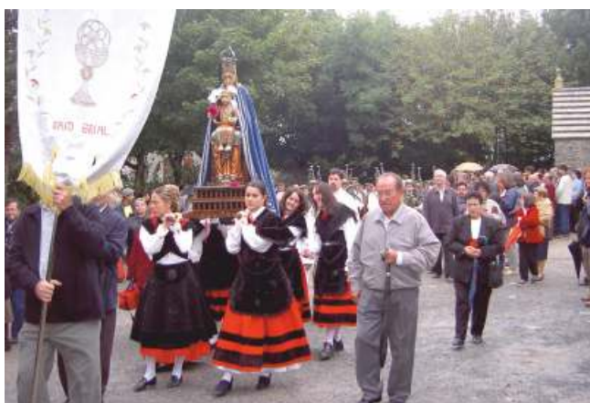
Ritual da procesión

A relixiosidade popular ten, ademais dunha dimensión práctica, un compoñente de pacto baseado na reciprocidade, que esixe do devoto a entrega dalgún ben para propiciar ao ente sacro ou para compensalo polo favor recibido. Por iso é común que se depositen diversas ofrendas no interior do templo. Unha moi xeral é a das “candeas de cera” –círios pequenos- que os fieis adquiren ben nun posto de venda de cera, situado no exterior do santuario, ou no que está colocado no lado dereito da entrada ao mesmo. Logo, deposítanos, acesos, tanto no exterior do santuario como no seu interior. Con respecto ao exterior hai un espazo, situado ao carón da parede lateral esquerda do recinto sacro, onde os devotos entregan esta ofrenda a dúas persoas, ligadas coa administración do santuario, que as depositan nuns lampadarios metálicos existentes para tal fin. En canto ao interior, hai dous lugares básicos: un, emprazado na parte inferior de onde está colocada a advocación mariana do Cebreiro para a súa