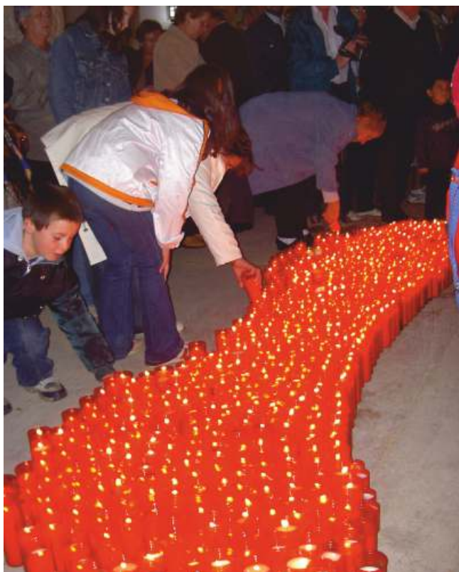
Devotos ofrecendo candeas

Así nos lo prometemos, así lo esperamos cumplir, mediante la gracia y auxilio de Dios del Santo Milagro, y de la Virgen nuestra Patrona.