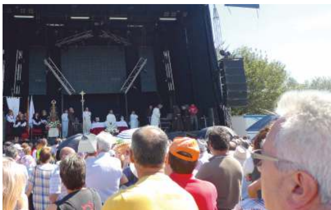
Misa solemne no exterior do santuario

Esta graza sacra está, como sucede con toda a relixiosidade popular, suxeita a un intercambio baseado no principio de dou para que me deas . Por tanto, a promesa á divindade reproduce dun xeito claro o sistema social vixente, no que polo xeral se moven as relacións humanas en función do sentido da racionalidade pragmática e na actuación de intermediarios que teñen como finalidade acadar certas metas a cambio de cartos