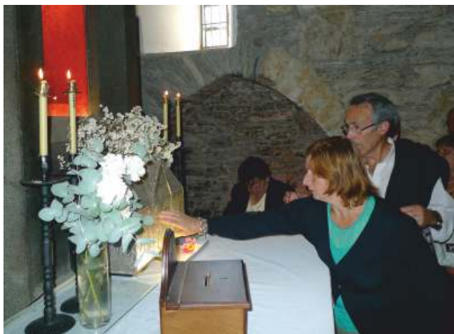
Ritual de contacto co sagrario

O relicario foi unha doazón dos Reis Católicos, logo do seu paso polo Cebreiro, co fin de que as reliquias se conservasen dun xeito digno. Trátase dunha caixiña de prata duns 15x15 cms., que amosa no seu interior dous fanais de cristal de roca, nos que se atopan os restos