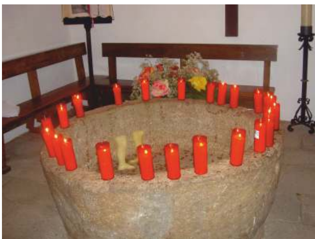
Pía bautismal de inmersión con candeas acesas

O século XVII marca xa unha etapa na que se comeza a facer patente a súa decadencia, influíndo unha serie de feitos: 1º. A mingua das peregrinacións a Santiago. 2º. O preito do Cebreiro coas súas igrexas filiais de San Martiño de Zanfoga, Santa María Madalena de Riocereixa, San Estevo de Liñares e Hospital da Condesa e, 3º O incendio que tivo lugar no ano 1641. Todo isto posibilita que no ano 1722, o Cebreiro teña que pedir un préstamo de dous mil ducados e, logo, contar co apoio económico do mosteiro de Valladolid do que dependía como priorado. A partir deste século, o declive vaise incrementando co paso do tempo ata que os monxes son expulsados de O Cebreiro como consecuencia das leis desamortizadoras de mediados