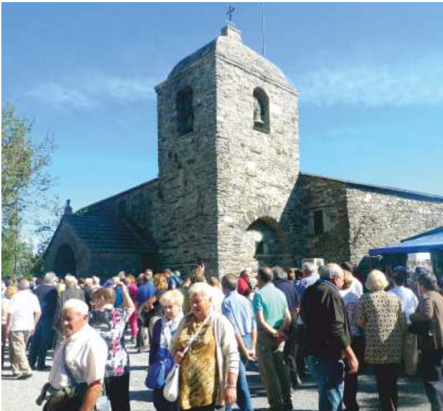
Vista exterior do santuario

O clima do concello é de tipo oceánico de montaña, o que motiva que os veráos sexan curtos e frescos e os invernos fríos e longos.