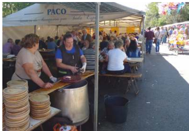
Posto de polbo

cara a Galicia, e máis concretamente á provincia de Lugo, senón tamén á comarca berciana de León. A vitalidade deste recinto sacro está fóra de dúbida, recibindo nos nosos tempos a centos de persoas cada ano non só os días da festividade, senón tamén calquera domingo do ano. Agora ben, sen milagres non hai posibilidade de crear devoción. E isto é así xa que os portentos se difunden entre os romeiros. Non obstante, ao ser o Cebreiro un lugar importante no camiño francés, case tódolos días do ano o santuario recibe a visita dalgúns peregrinos. Algúns acoden con devoción para venerar a advocación mariana e as santas reliquias. Outros, fano máis ben por curiosidade e para contemplar a dimensión artística do templo.