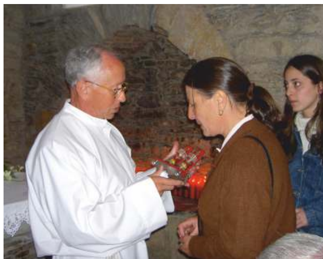
Un crego impón as santas reliquias

Ambos os dous elementos foron presentados na Exposición Eucarística, que se celebrou en Lugo no ano 1896, coincidindo co 2º Congreso Eucarístico. Nela houbo 16 cálices 18 . Tanto o cáliz como a patena