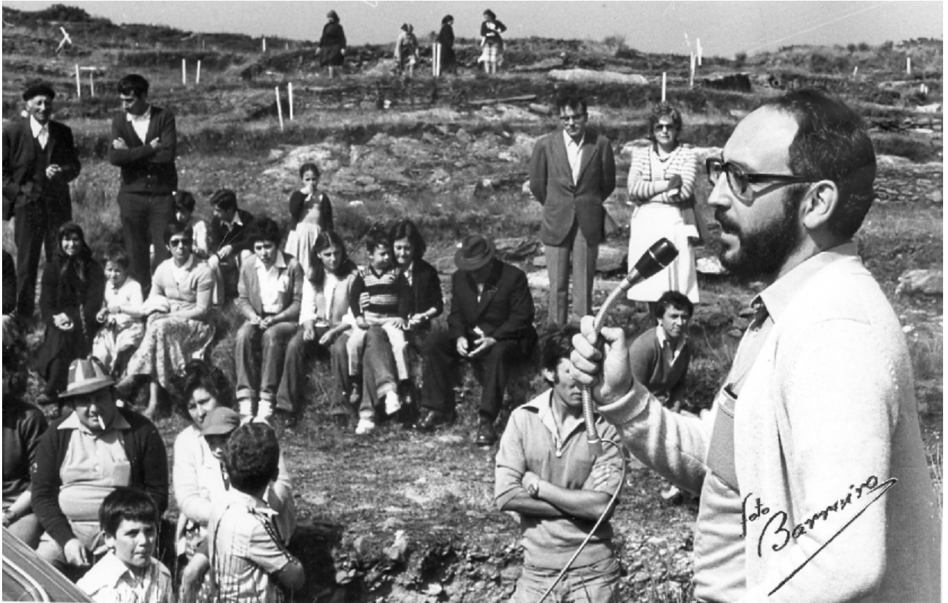
I Festa da Mocidade Balura. 1979

idear accións específicas para converter o público xenérico en visitante.